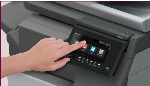
Cenami overené používateľské rozhranie Sharp – navrhnuté pre jednoduchší život

Naše zariadenia sú vybavené LCD dotykovým panelom s oceňovaným používateľským rozhraním Sharp*, ktoré prináša intuitívny displej a jednoduchý prístup k bežne používaným funkciám. Prípadne si ho môžete prispôsobiť presunutím požadovaných ikon z ponuky tak, aby vyhovoval vašim potrebám.